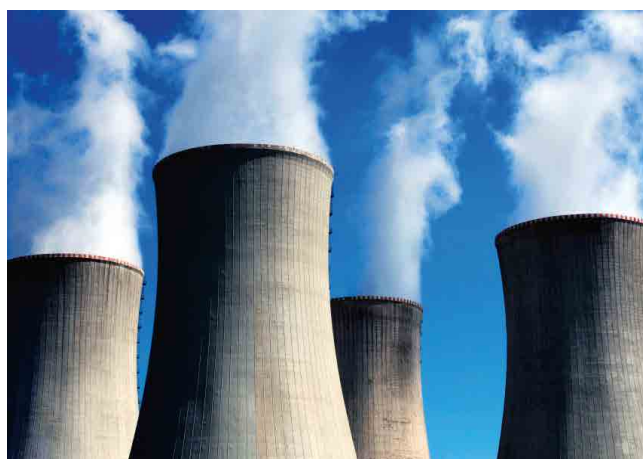
SISTEMAS DE GERAÇÃO E DISTRIBUIÇÃO DE ENERGIA POWER GENERATION AND DISTRIBUTION SYSTEMS