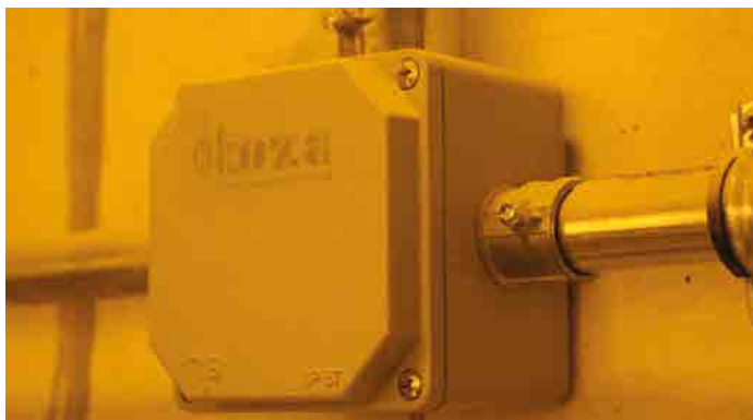
APLICAÇÃO DE FÁBRICA- FACTORY / İZMİR