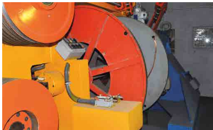
APLICAÇÃO DE MÁQUINA - MACHINERY / İSTANBUL