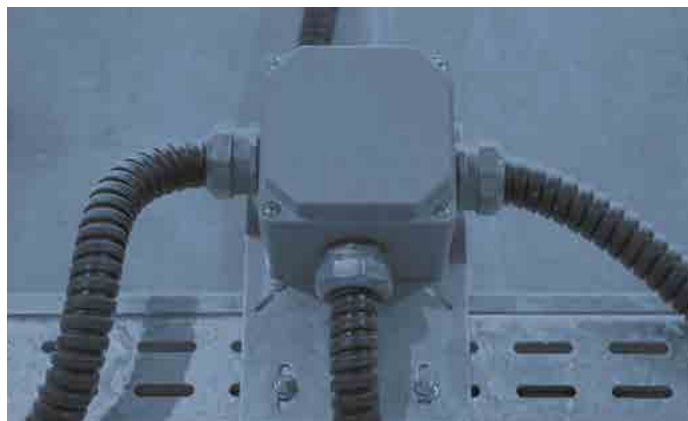
APLICAÇÃO DE FÁBRICA - FACTORY / İZMİR