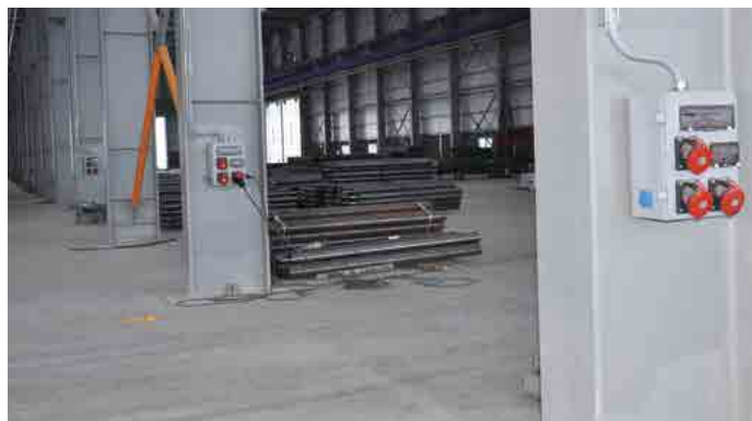
APLICAÇÃO DE FÁBRICA - FACTORY / İSTANBUL