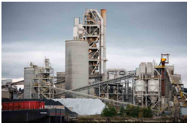
INDÚSTRIA DE CIMENTO CEMENT INDUSTRY