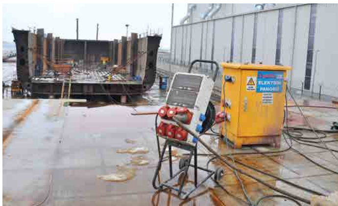
APLICAÇÃO DO ESTALEIRO - SHIPYARD / YALOVA