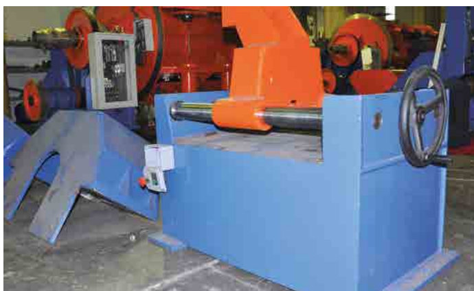
APLICAÇÃO DE MÁQUINA- MACHINERY / İSTANBUL