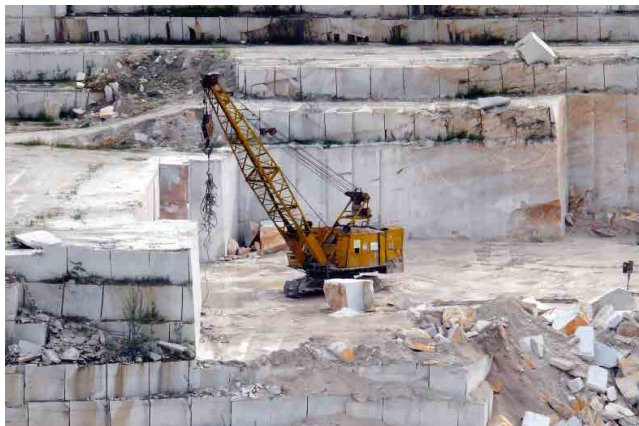
INDÚSTRIA DE MÁRMORE E PEDRA MARBLE AND STONE INDUSTRY