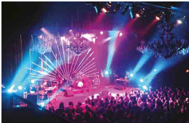
INDÚSTRIA DE TRANSMISSÃO (SISTEMAS DE SOM E LUZ) BROADCASTING INDUSTRY (SOUND & LIGHT SYSTEMS)