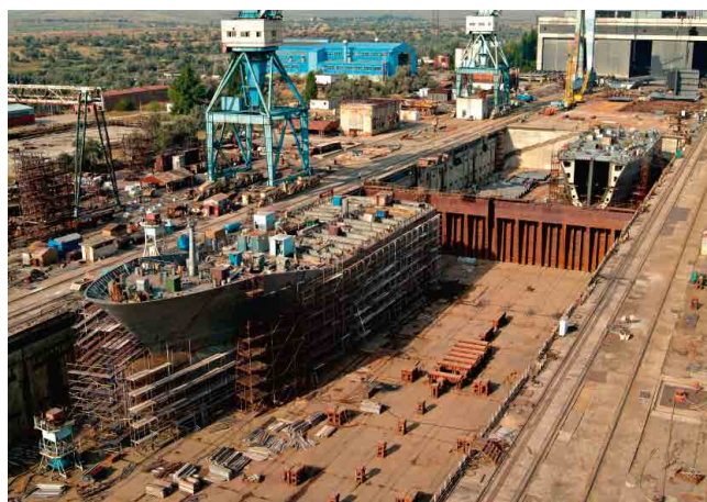
NAVIOS E INDÚSTRIA DE CONSTRUÇÃO DE NAVIOS SHIPYARDS & SHIP BUILDING INDUSTRY