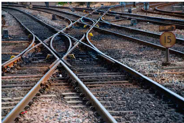
CAMINHOS DE FERRO RAILWAYS