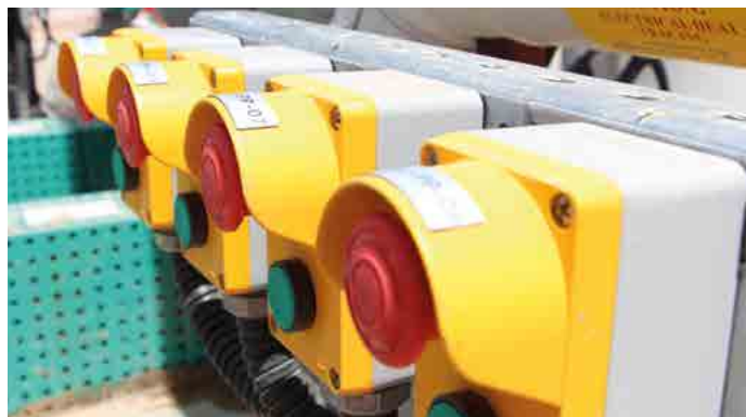
APLICAÇÃO DE FÁBRICA - FACTORY / İZMİR