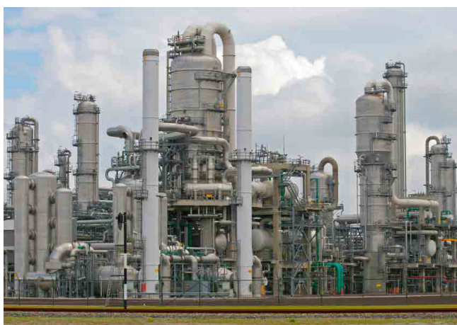
INDÚSTRIA PETROQUÍMICA PETROCHEMICAL INDUSTRY