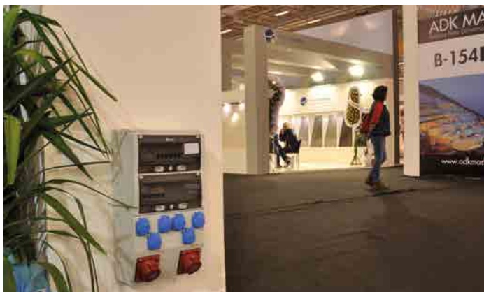
APLICAÇÃO DA ÁREA JUSTA - EXHIBITION / İZMİR