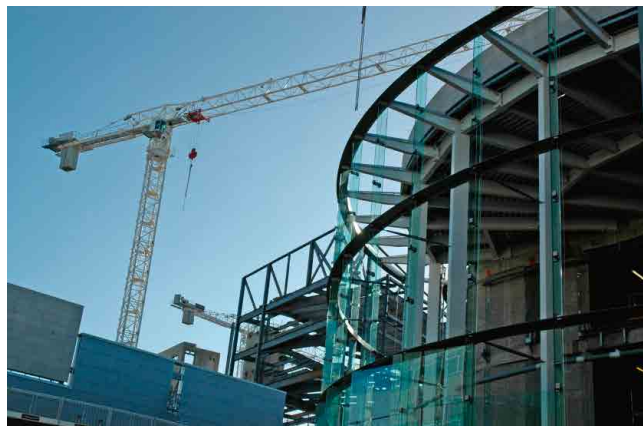
CONSTRUÇÃO CONSTRUCTION FIELD