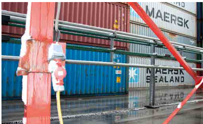
APLICAÇÃO PORTUÁRIA- PORT / İSTANBUL