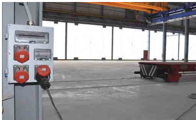
APLICAÇÃO DE FÁBRICA - FACTORY / İSTANBUL