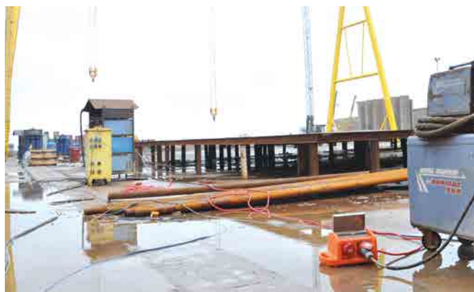
APLICAÇÃO DO ESTALEIRO - SHIPYARD / YALOVA