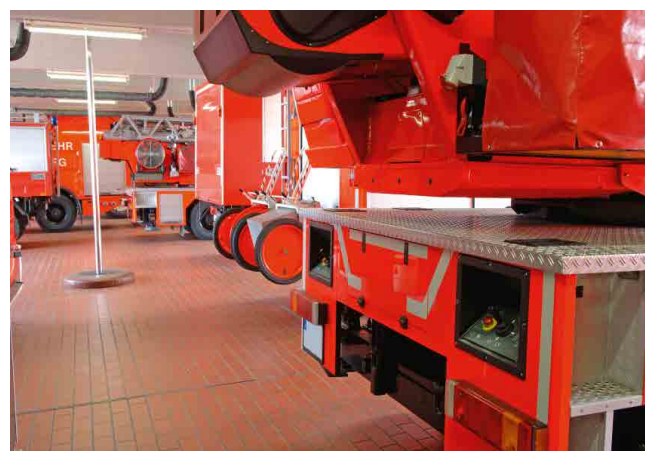
EQUIPAMENTOS DE BRIGADA DE INCÊNDIO FIRE BRIGADE EQUIPMENT