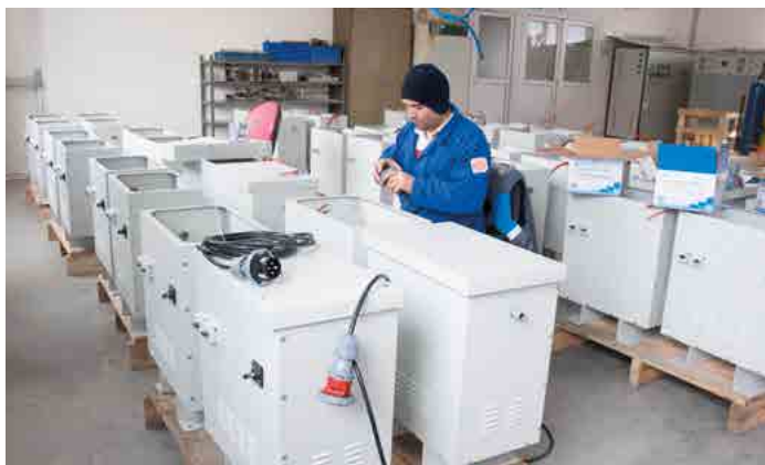
APLICAÇÃO DE MÁQUINA- MACHINERY / İSTANBUL