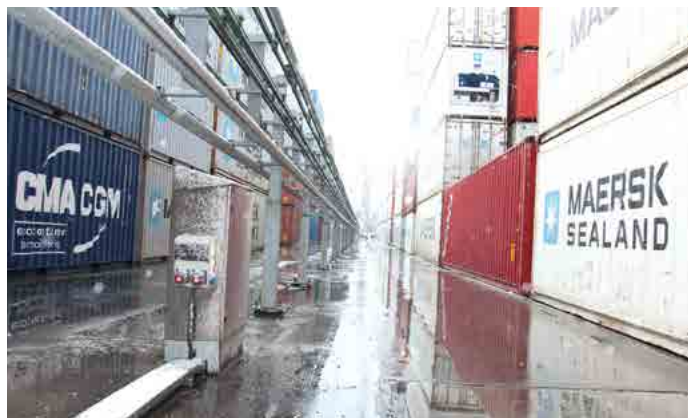
APLICAÇÃO PORTUÁRIA - PORT / İSTANBUL