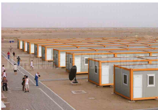
CONSTRUÇÕES PRÉ-FABRICADAS PREFABRICATED BUILDINGS