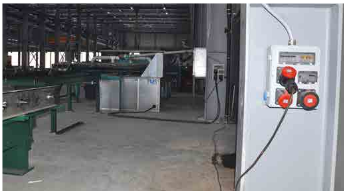
APLICAÇÃO DE FÁBRICA - FACTORY / İSTANBUL