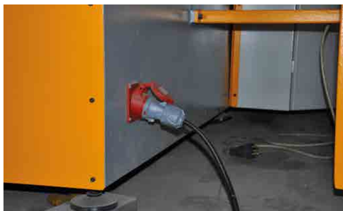
APLICAÇÃO DE MÁQUINA - MACHINERY / GAZİANTEP