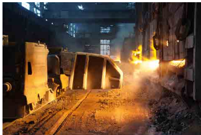
INDÚSTRIA DE FERRO E AÇO IRON & STEEL INDUSTRY