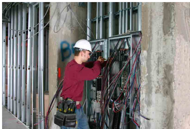
OBRAS DE INSTALAÇÃO ELÉTRICA ELECTRICAL INSTALLATION WORKS