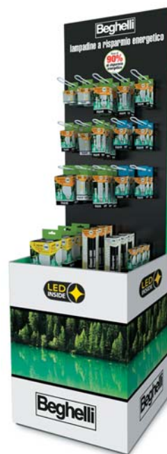
CÓD. 845176000 (EXPOSITOR DE CHÃO)

Expositores com suportes portablister preparados para a exposição de lâmpadas nos postos de venda.