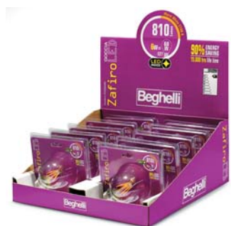
CÓD. 845202000 (EXPOSITOR DE CHÃO)

Expositores personalizados sobre o produto, preparados para a exposição de lâmpadas nos postos de venda.