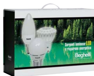
MALA DE AMOSTRAS CÓD. 845192000