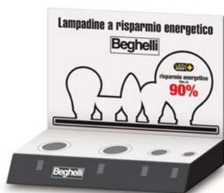
EXPOTESTER CÓD. 169010029