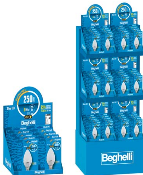
CÓD. 845193000 (EXPOSITOR DE CHÃO)